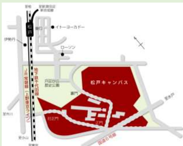
駅からのアクセス

https://www.h.chiba-u.jp/access/index.html